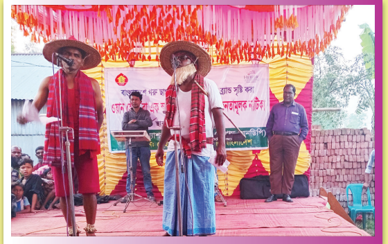
আয়োজিত মঞ্চ নাটকের অংশ বিশেষ

মূলত ওয়ান হেলথ বা এক স্বাস্থ্য ও পুষ্টি বিষয়ের উপর ভিত্তি করে নাটিকাটি তৈরি করা হয়। নাটিকাটি গম্ভীরা গানের মাধ্যমে পরিচালনা করেন চাঁপাই নবাবগঞ্জের ঐতিহ্যবাহী গম্ভীরা দল। প্রথমে অভিনয় শিল্পীরা দেশের গান দিয়ে অনুষ্ঠান শুরু করেন। এরপর প্রকল্পের কার্যক্রম গম্ভীরা গানের মাধ্যমে উপস্থাপন করেন। প্রকল্পের সদস্য হলে কিভাবে পরিবারের উন্নয়ন করা যায় এবং প্রকল্প যে সকল কাজ বাস্তবায়ন করছে তা তুলে ধরা হয়। যেমন; প্রাণি স্বাস্থ্য ক্যাম্পের আয়োজন করা, কৃষিভিত্তিক কারিগরি যন্ত্রপাতি/উপকরণ সহায়তা করা, গরুর জাত উন্নয়নের জন্য কৃত্রিম প্রজনন সেবা প্রদান করা, ঘাসের উৎপাদন বৃদ্ধি, বাজার স্থাপন এবং ফ্রেতা ও বিক্রেতার মধ্যে সংযোগ স্থাপন করা, ইউনিয়ন পর্যায়ে প্রকল্পের কার্যক্রম অবহতিকরণ করা, প্রাথমিক স্কুলে বিনা মূল্যে টিফিন প্রদান করা, নিরাপদ খাদ্য, জুনোটিক রোগ, ওয়ান হেলথ বিষয়ে সচেতনতামূলক ক্যাম্পেইন করা, পরিবেশের উন্নয়নে বায়ো গ্যাস প্লান্ট স্থাপনে সদস্যদের সহায়তা প্রদান করা, ইত্যাদি।