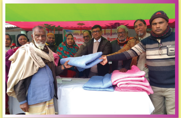
কম্বল তুলে দিচ্ছেন মহিলা ভাইস চেয়ারম্যান ও এনডিপি'র পরিচালক (ঋণ সহায়তা কর্মসূচি)