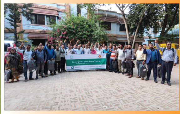
দক্ষতা উন্নয়ন বিষয়ক প্রশিক্ষণে অংশগ্রহণকারীবৃন্দ