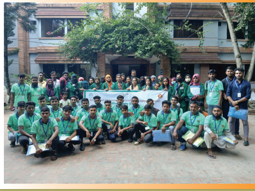
শিক্ষানবিশি প্রশিক্ষণে অংশগ্রহণকারী তরুণ ও তরুণী

পল্লী কর্ম-সহায়ক ফাউন্ডেশন (পিকেএসএফ) এর অর্থায়নে পরিচালিত রেইজ প্রকল্পের আওতায় নিম্ন আয়ের পরিবারভুক্ত তরুণদের শিক্ষানবিশি কর্মসূচির মাধ্যমে টেকসই কর্মে সম্পৃক্তের লক্ষ্যে সিরাজগঞ্জ, নাটোর এবং বগুড়া জেলার প্রকল্পভুক্ত শাখার আওতায় প্রশিক্ষণ কার্যক্রম পরিচালিত হচ্ছে। প্রশিক্ষার্থীদের খাই এ্যান্ড এ্যালুমিনিয়াম ফেব্রিকেশন, ওয়েল্ডিং এ্যান্ড ফেব্রিকেশন, ইলেকট্রিক্যাল ইনস্টলেশন এ্যান্ড মেইন্টেন্যান্স, এসি-ফ্রিজ সার্ভিসিং, মোটরসাইকেল সার্ভিসিং, মোবাইল ফোন সার্ভিসিং, গ্রাফিক ডিজাইন এন্ড মাল্টিমিডিয়া, ওয়েবপেইজ ডেভেলপমেন্ট, ডিজিটাল মার্কেটিং, বিউটিফিকেশন ও স্মল ইঞ্জিনিয়ারিং সহ যাবতীয় বিষয়ে ৬ মাস মেয়াদি হাতে-কলমে প্রশিক্ষণ প্রদান করা হচ্ছে। মে-অক্টোবর ২০২৪ মেয়াদে সংশ্লিষ্ট ট্রেন্ডের ২৮ জন ক্রাফটসপার্সন/ওস্তাদের মাধ্যমে ২৮ জন তরুণী এবং ৩২ জন তরুণ, সর্বমোট ৬০ জন ৬মাস মেয়াদী এ কারিগরি প্রশিক্ষণের পাশাপাশি ০৫ দিনের জীবন দক্ষতা উন্নয়ন প্রশিক্ষণ গ্রহণ করেন। সেই সাথে তাদেরকে প্রশিক্ষণ ভাতা এবং পরবর্তীতে উদ্যোক্তা হিসেবে গড়ে উঠতে কাউন্সেলিং ও কর্মসংস্থান সৃষ্টিতে আগ্রহী তরুণদের খণ সহায়তা প্রদান করা হয়েছে।