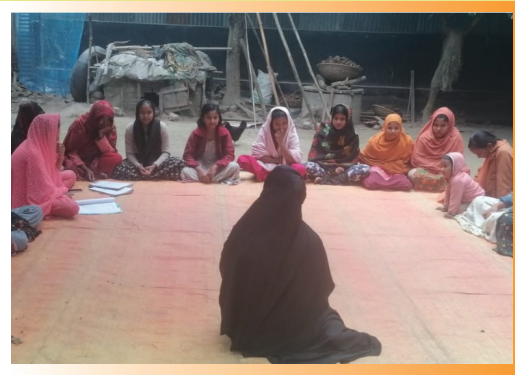
উঠান বৈঠকের অংশ বিশেষ

বেসরকারি উন্নয়ন সংস্থা ন্যাশনাল ডেভেলপমেন্ট প্রোগ্রাম (এনডিপি) এর কৈশোর কর্মসূচি সিরাজগঞ্জ সদর উপজেলায় সফলভাবে বাস্তবায়িত হচ্ছে, যার সহযোগী সংস্থা পল্লী কর্ম-সহায়ক ফাউন্ডেশন (পিকেএসএফ)। "মেধা ও মননে সুন্দর আগামী" এই প্রতিপাদ্য বিষয় নিয়ে সম্প্রতি কৈশোর কর্মসূচির আওতায় মেন্টর ও কিশোর-কিশোরী সদস্যদের নিয়ে একটি উঠান বৈঠক অনুষ্ঠিত হয়।