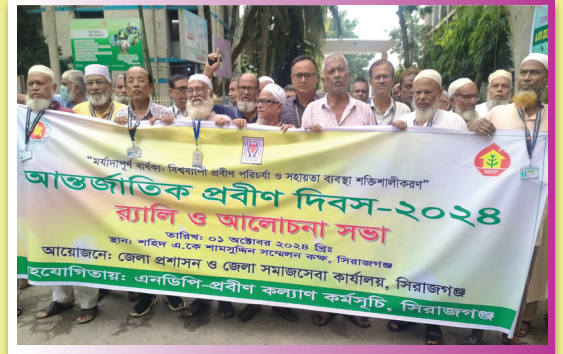
প্রবীণ দিবসে আয়োজিত র্যালি