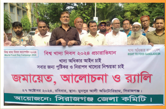
বিশ্ব খাদ্য দিবসে আয়োজিত র্যালির অংশ বিশেষ

সিরাজগঞ্জে নিত্য প্রয়োজনীয় দ্রব্যের মূল্য কমানোর দাবিতে জেলা প্রশাসকের কাছে স্মারকলিপি প্রদান করা হয়েছে। "Right to Food For Better Life and a Better Future" প্রতিপাদ্য বিষয় নিয়ে এই কর্মসূচি আয়োজন করা হয়। যার মূল লক্ষ্য ছিল বৈষম্য হ্রাস এবং সামাজিক সুরক্ষা কর্মসূচির পরিসর বৃদ্ধি করে খাদ্যসহ অন্যান্য নিত্য প্রয়োজনীয় দ্রব্যের মূল্য কমানোর দাবিতে সচেতনতা তৈরি করা।